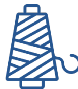
Фурнитура и комплектующие