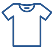
Женская и мужская одежда