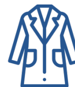
Пальто и верхняя одежда