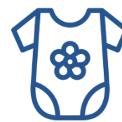
Детская одежда и школьная форма