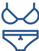
Нижнее белье и домашняя одежда