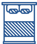
Текстиль для дома

Категории товаров в рамках Торгово-закупочной сессии: